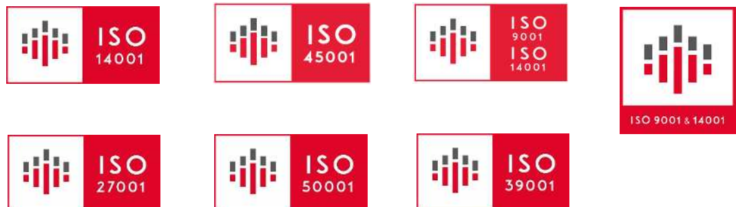
図 4 規格ごとに使用する ロゴマーク（赤色）の例

IMJ 認証マークは、製品又はその包装に用いない、又は製品の適合性を示すと解釈される可能性のある他のいかなる方法にも用いないようにしてください。