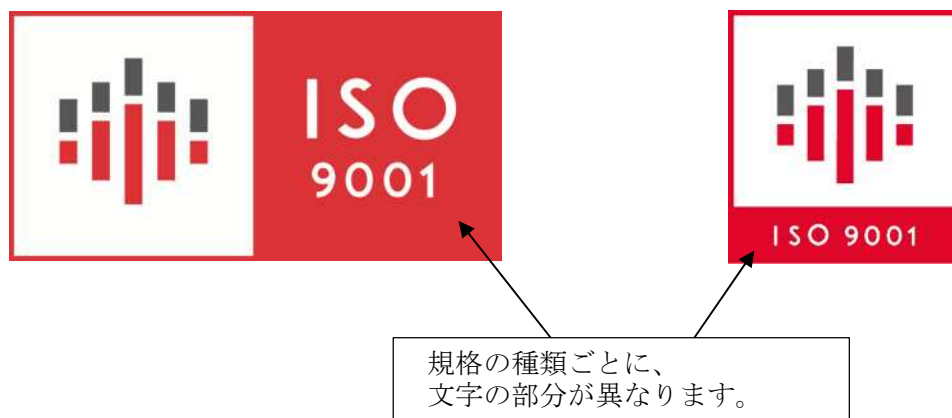
図1 ログマークの構成 (赤色)

IMJ 認証マークは図1のように2種類あり、赤色 (図1)、黒色1色 (図2)、金色1色 (図3) より、お選びいただけます。